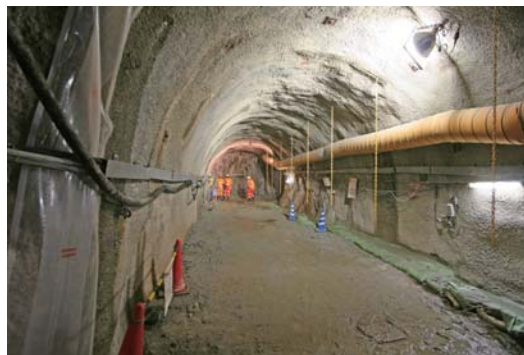
深度500m研究アクセス南坑道