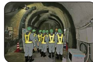
施設見学会（深度300mステージ）

工事現場での安全の確保のため、小学生の方は4年生以上で保護者同伴をお願いします。また入坑の際は、安全装備（つなぎ服・反射ベスト・ヘルメット・安全長靴・軍手・坑内 PHS など）を着用して頂きます。工事現場ですので、狭くて急な階段等もあります。階段の昇降等が困難な方など自立歩行に支障のある方や高所、閉所恐怖症の方などは研究坑道に入坑できない場合がありますので、事前にご確認をお願いいたします。