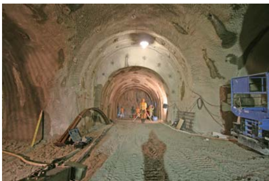
深度500m研究アクセス北坑道